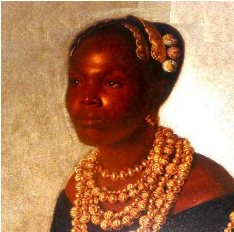
Peinture brésilienne (19 ème siècle).