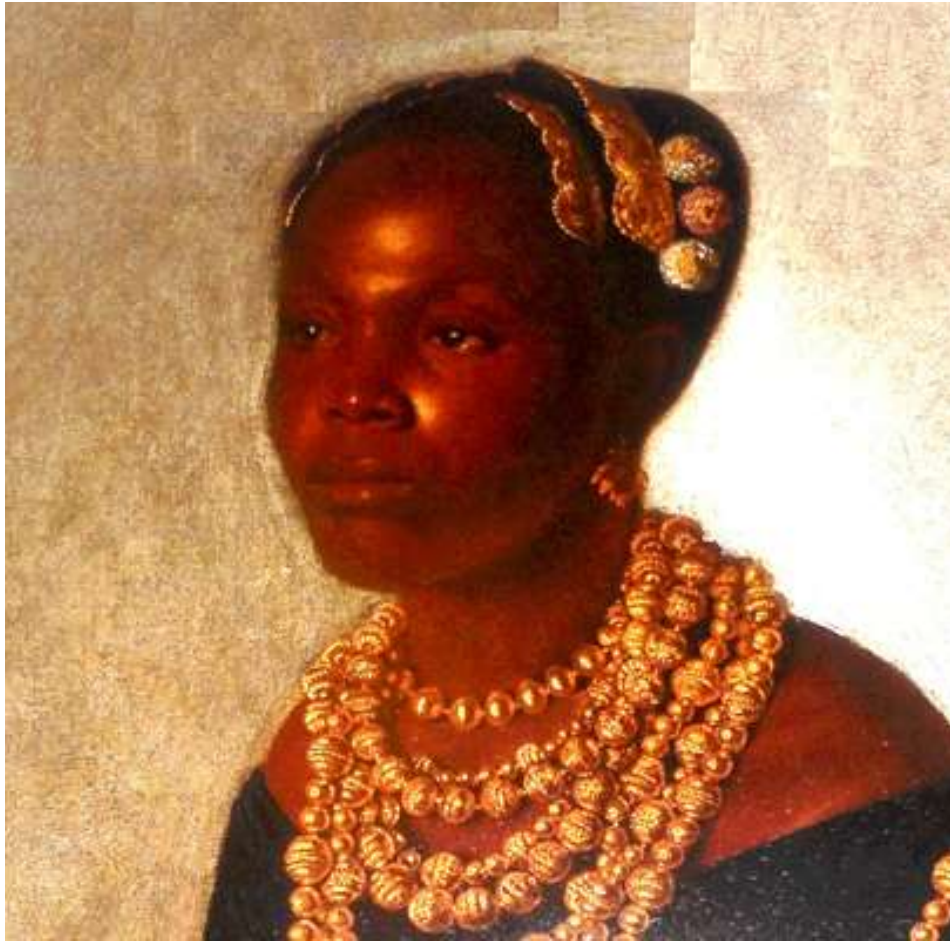
Peinture brésilienne (19 ème siècle).