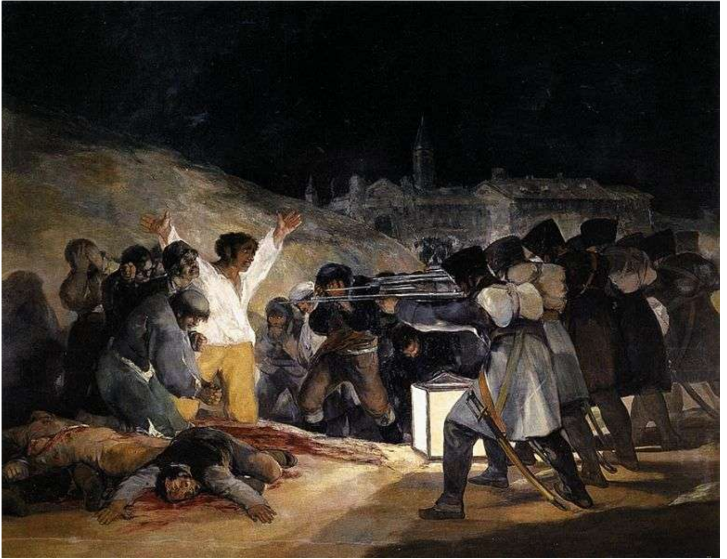
GOYA F., Tres de Mayo (1814).