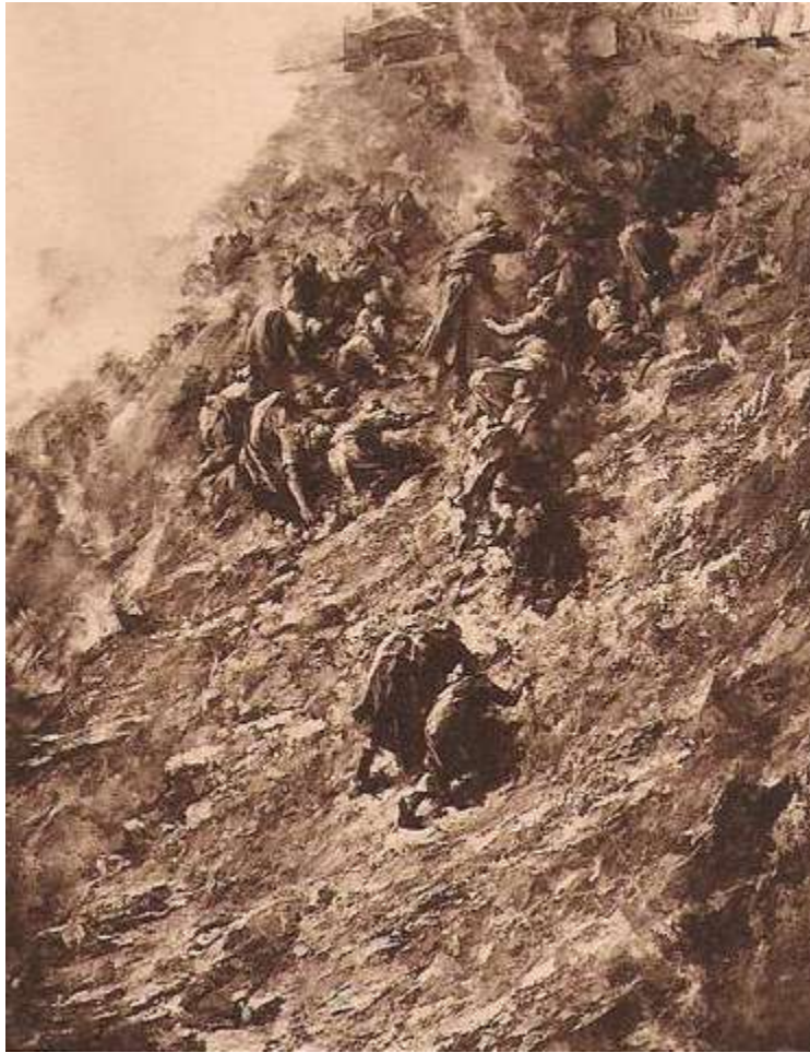
DOUARD Cécile, Le terril (1898).