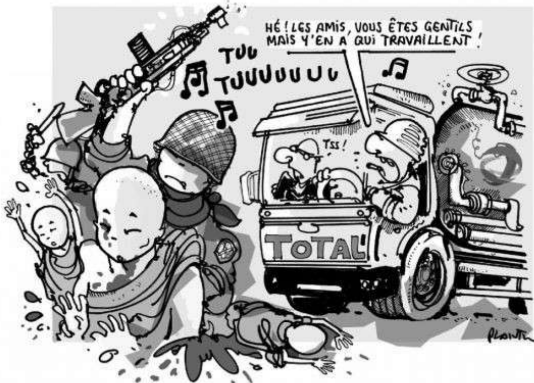
Dessin de PLANTU dans Le Monde .