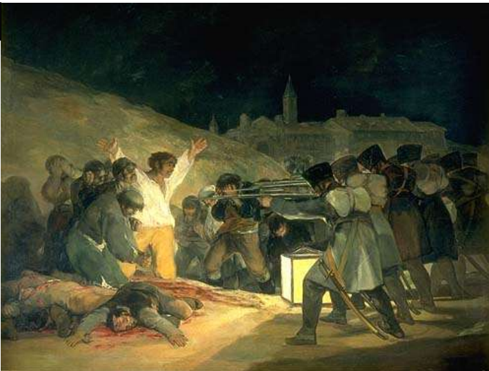
« Le 3 mai 1808 », Francisco Goya, 19 ème siècle