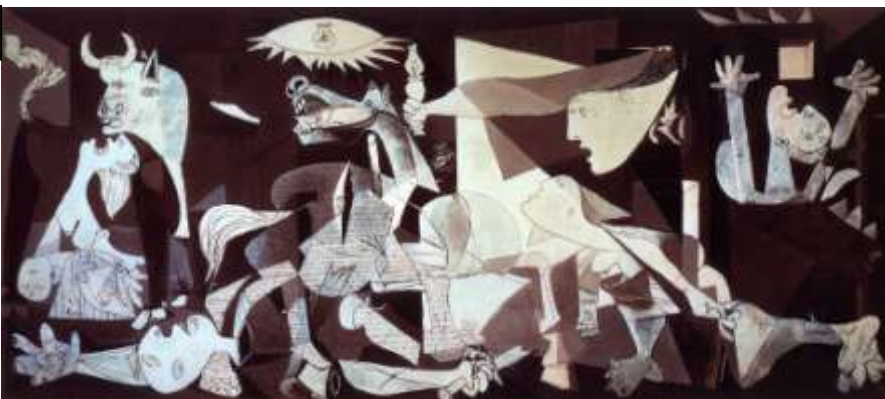
« Guernica », Pablo Picasso, 1937