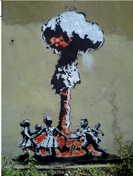
Banksy, 21 e siècle