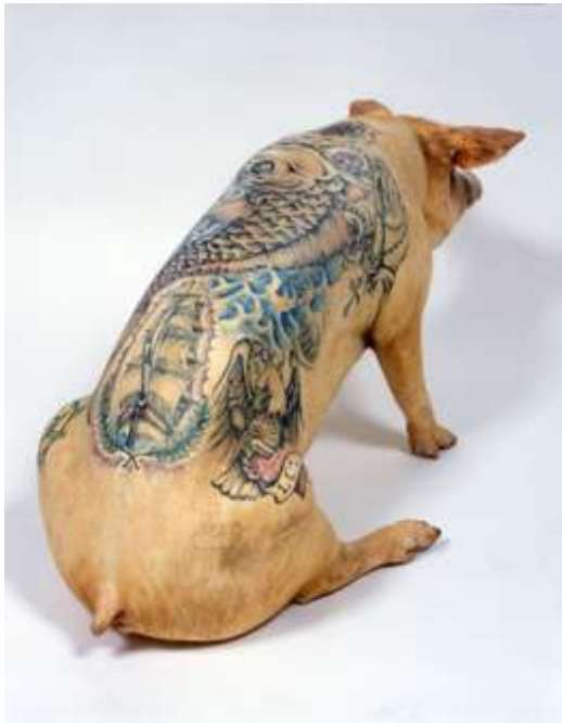
Porcs tatoués de Wim Delvoye, 2010

Regarde attentivement les photos suivantes et donne ton avis personnel sur celles-ci.