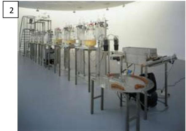
Wim Delvoye, « Cloaca », 2000