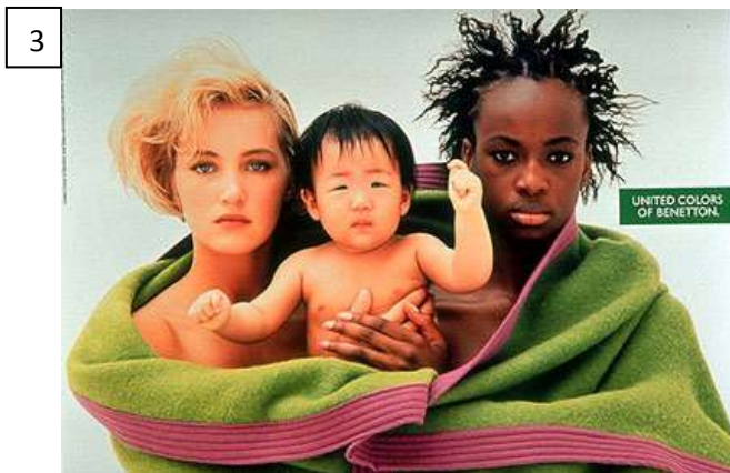
Publicité de la marque Benetton, 20 ème siècle