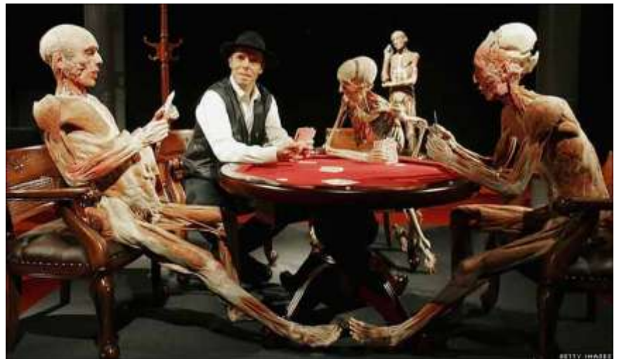
Plastination de Von Hagens, exposition à Bruxelles, 1997