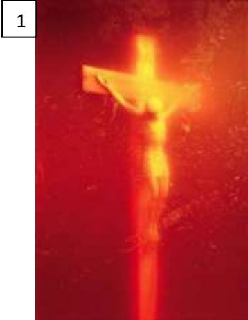
« Immersion Piss Christ », Andres Serrano, 1987

Parmi les œuvres suivantes, choisis-en une qui te percute/ qui te frappe particulièrement, par rapport au message qu'elle véhicule. Fais de même avec celle que tu trouves insipide (qui te laisse de marbre). Explique pourquoi.