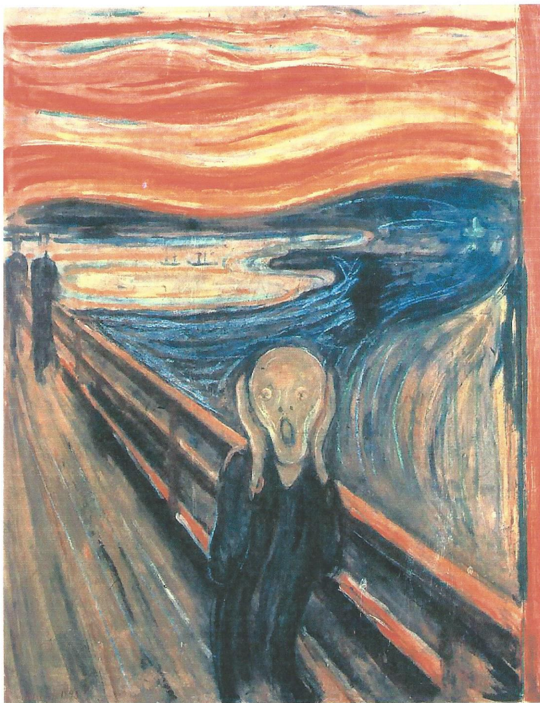
« Le Cri », de E. Munch, 1894

1) Observe le tableau reproduit ci-dessous. Décris ce que tu vois et explique ce que, selon toi, l'auteur du tableau a voulu exprimer.